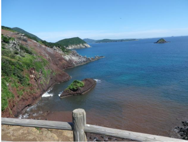
【軍艦を思わせる『軍艦瀬』】