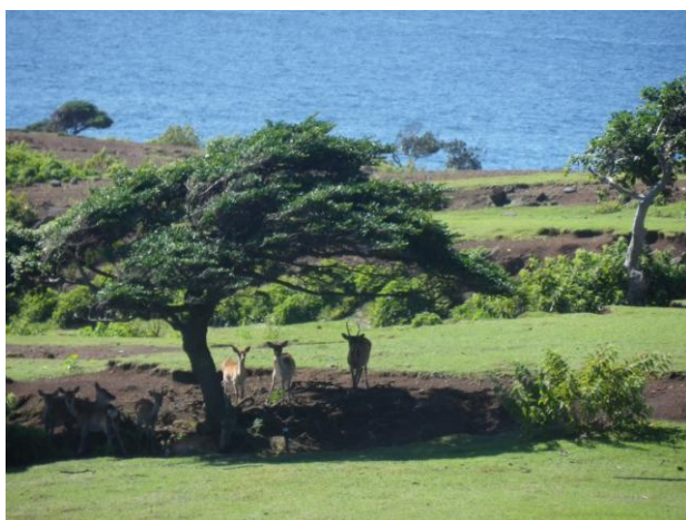
【島には 400 頭の野生のシカが生息する】

東洋文化研究者のアレックス・カー氏が、この島を「奇跡の島」といったのもうなずける。またしばらくの間、思わず立ちつくしてしまう美しさがこの島にはあった。ノスタルジックという言葉では、到底おさまりきれない景色がこの島にはある。この島はまるで訪れる人に、『『本当の豊かさ』とは？』『『生きる』とは？』という大きな問いかけを与えているようだった。