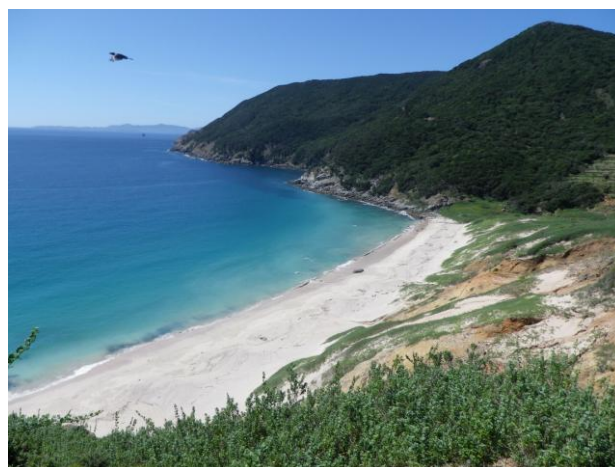
【野首海岸：果てしなく続くコバルトブルーの海と 400m の白い砂浜】