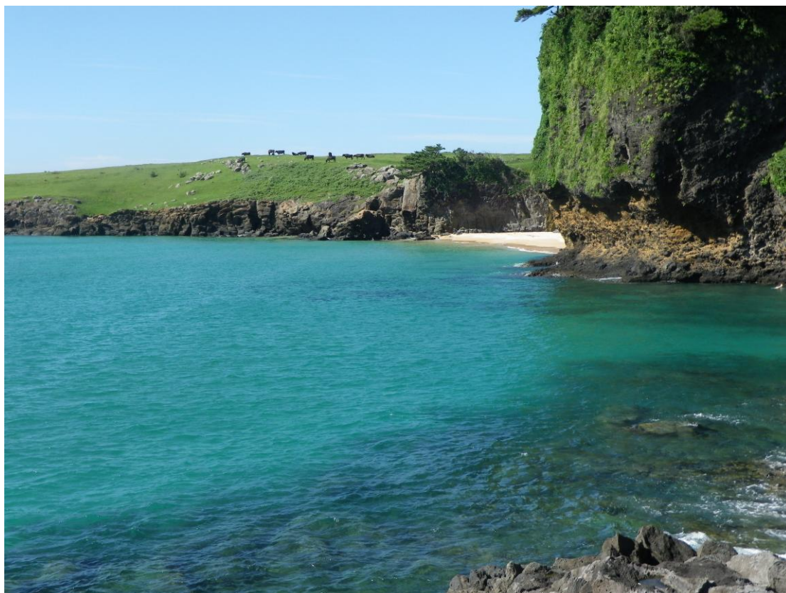
【五両だき：幾万年の海蝕によってできた奇景】

鳥居は「鎮真鳥居」と呼ばれ、旧平戸藩領内にだけ建てられたもの。海に向かって立つ鳥居を抜けると、正面に野崎島の「沖の神嶋神社」を望むことができる。